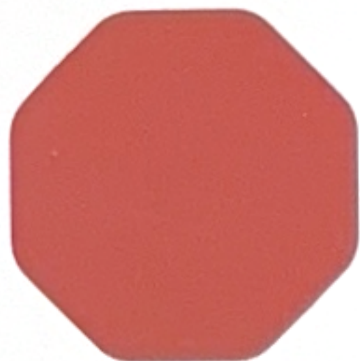
Rojo Óxido BA3T - 3750