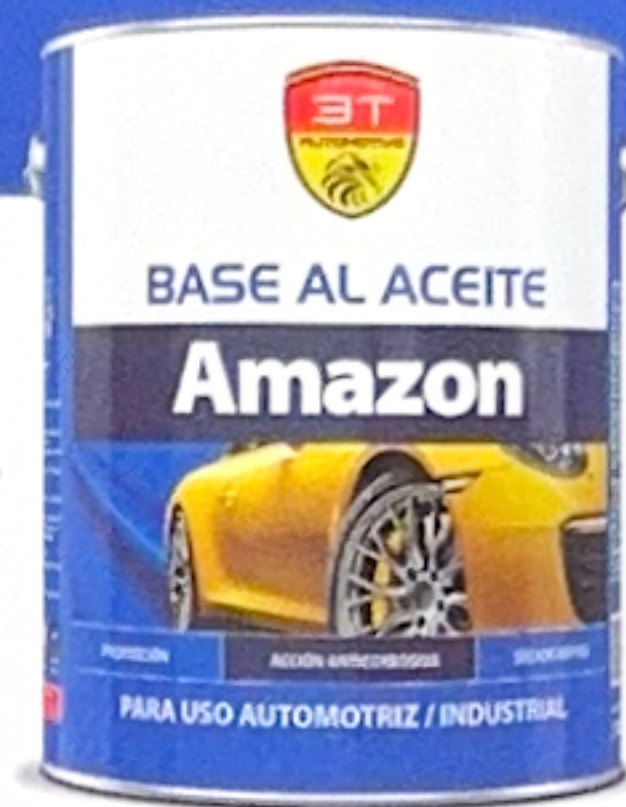
También Blanco BA3T - 1000