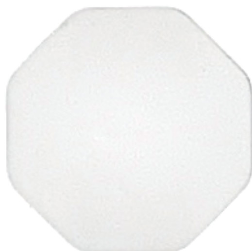
Gris BA3T - 7315